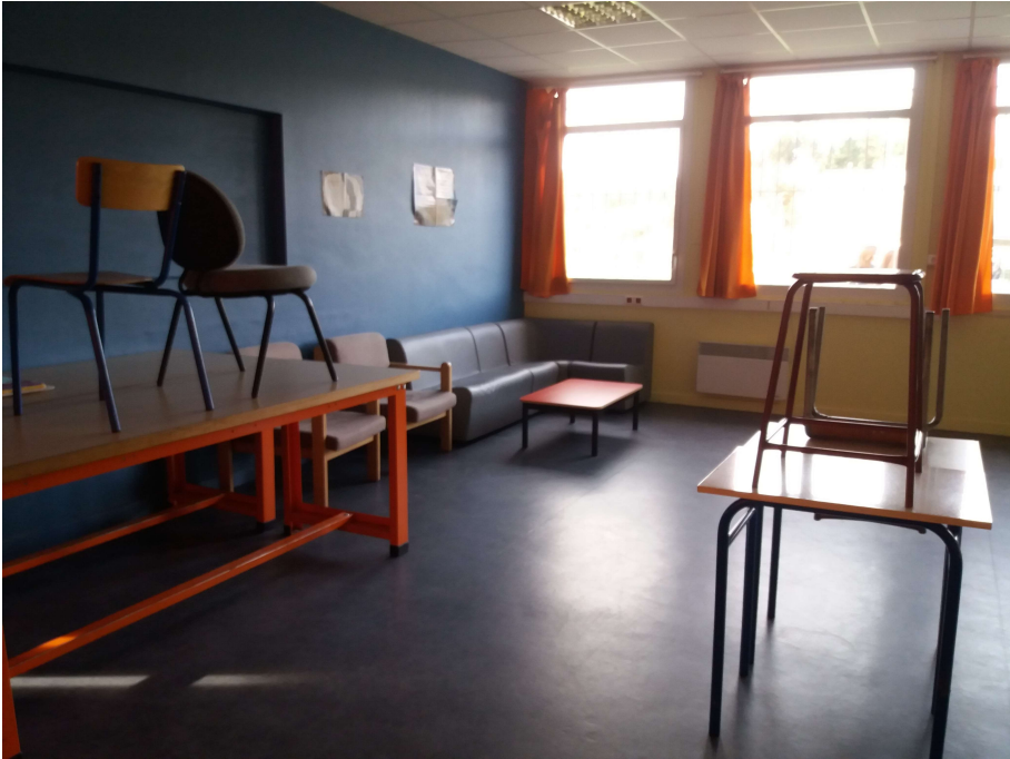
Salle de détente et de jeux de société