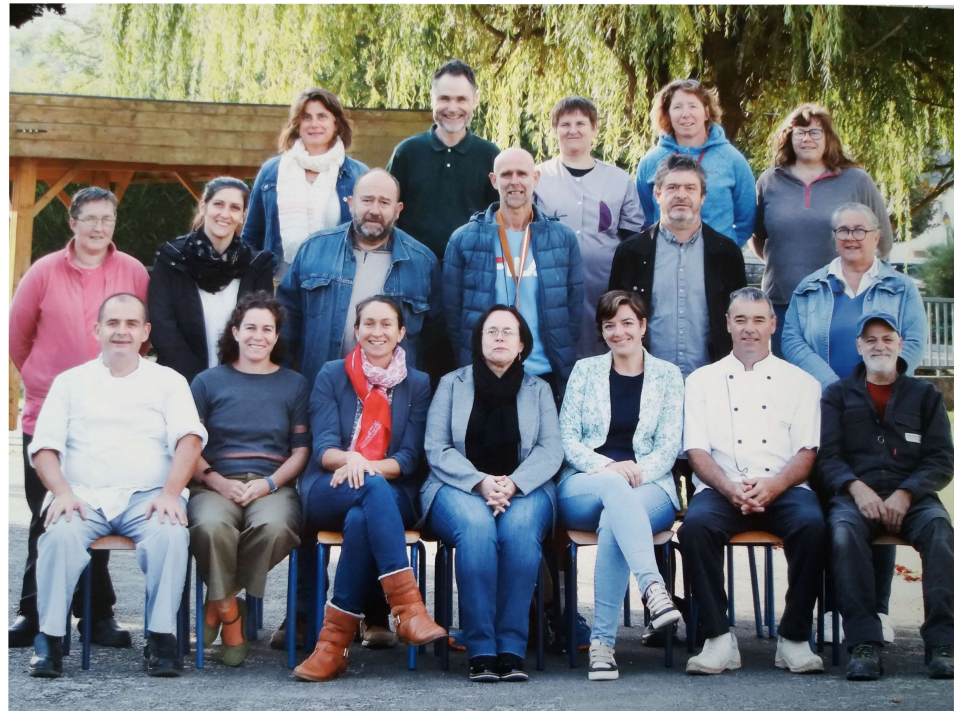
Équipe du collège en 2022/2023