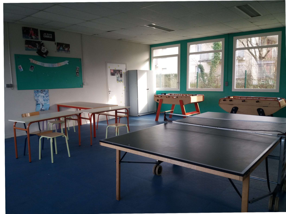
Salle de tennis de table